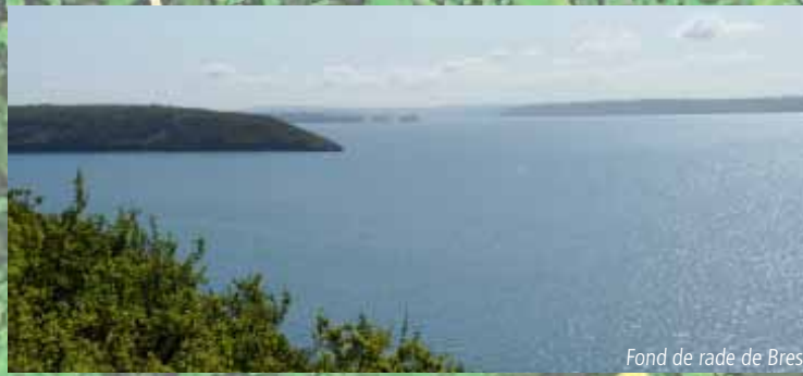
Fond de rade de Brest