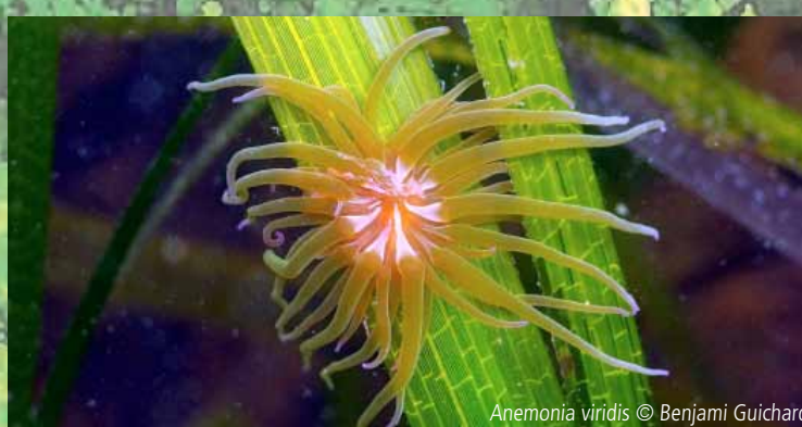
Anemonia viridis