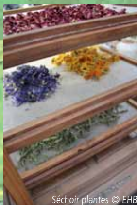
Séchoir plantes