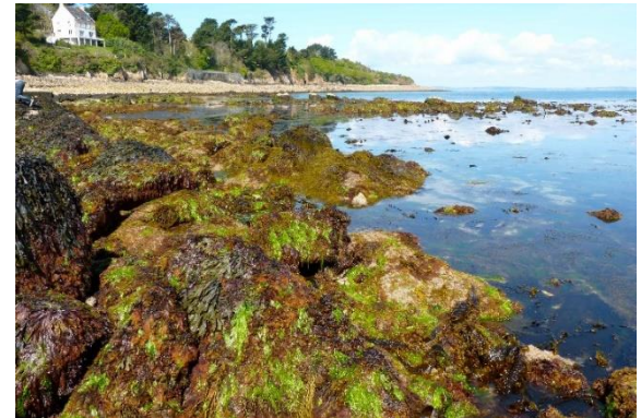
L'estran à marée basse

L'estran peut être de plusieurs natures : sableux, graveleux, ou encore rocheux .